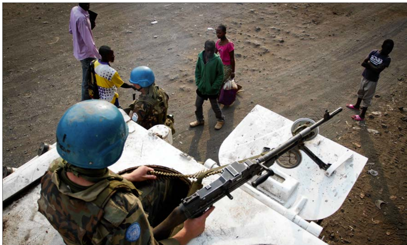
Soldater fra FN's fredsbevarende styrke på patrulje i provinshovedstaden Goma. Konflikten i Congo har stået på siden 1996 og har foreløbig kostet flere end fem millioner civile livet.

Læs flere nyheder på jp.dk/international