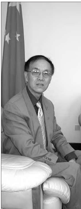
Kinas ambassadør i Ghana Yu Wenzhe siger, at han ikke frygter, at et nyt bjerg af gæld skal ødelægge de afrikanske lande.

Vestlige analytikere spekulerer over, om Kinas lempelige långivning, der utvivlsomt vil komme til at hæmme de afrikanske regerings handlefrihed, er et bevidst træk fra