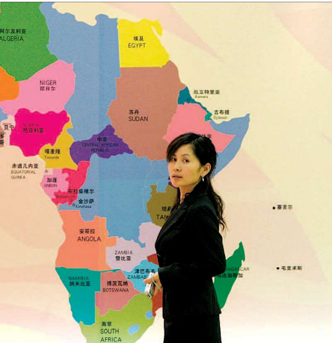
Kinas samhandel med Afrika er mere end tidoblet siden årtusindskiftet. En win-win situation for begge parter?

skabsforeninger, som gør meget for at informere om afrikansk og kinesisk levevis, så barriererne og misforståelserne bliver brudt ned. – Vi har ingen plan for Afrika; sådan én bør udvikles af afrikanerne selv. Vi kommer ikke og fortæller, hvad de skal gøre. Vi lytter. Vi vil af et ærligt sind hjælpe Afrika – men på en win-win-måde, for vi er her også for at skabe profit, smiler ambassadør Wenzhe.