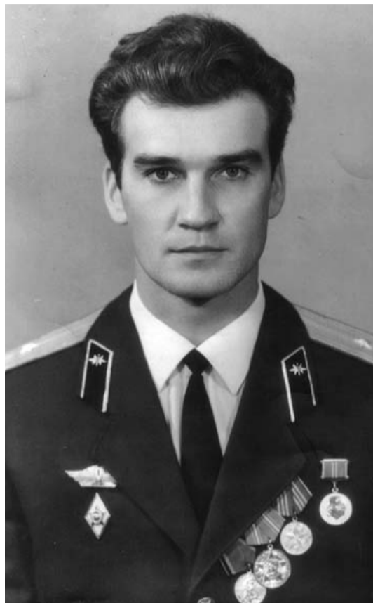
INTEGRITET. Major Stanislav Petrov holdt hovedet koldt.

holdt stand. Han var ikke sikker på, at der var dødbringende våben på vej mod hans land. Tog han fejl, ville de første atomraketter komme til syne på de sovjetiske radarskærme inden for et kvarter.