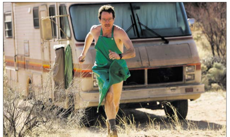
Bryan Cranston som Walter White løber for sit liv i dramaserien "Breaking Bad" – se den!

Et helt frit tv-valg burde være en selvfølge i et frit land.