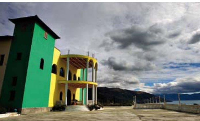
Tilhængerne af bektashireligionen samles ikke i moskeer, men i en slags tempel, der kaldes en tekke. Her ses en ny tekke, som troner på en bjergside i kystbyen Vlora